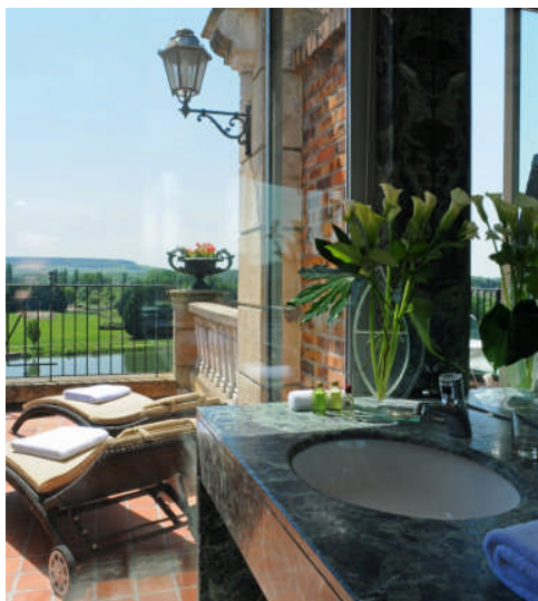
L'une de nos 32 chambres avec ou sans vue sur la rivière